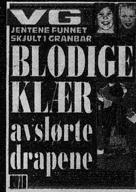
VG 22. mai 2000