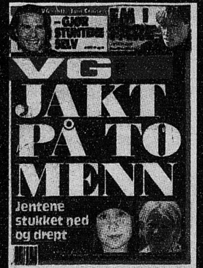
VG 23. mai 2000