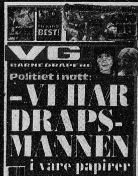
VG 24. mai 2000