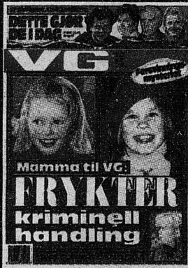
VG 21. mai 2000

Baneheia-saken gir en tydelig indikasjon på at den tekniske siden av politiarbeidet får stadig større betydning i kriminalsaker. DNA-tester er viktig og blir viktigere. Første gang det ble brukt i en drapssak, var i 1990, da en mann fra Mysen ble dømt til 21 års fengsel etter å ha drept en ung, utvikelingshemmet kvinne. De senere årene har denne metoden vært aktuell blant annet i Bjarkøy-saken, Sjøvegan-saken, Berit Hanke-saken og Birgitte-saken. En DNA-prøve er ifølge Kri-