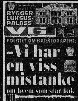
VG 30. mai 2000